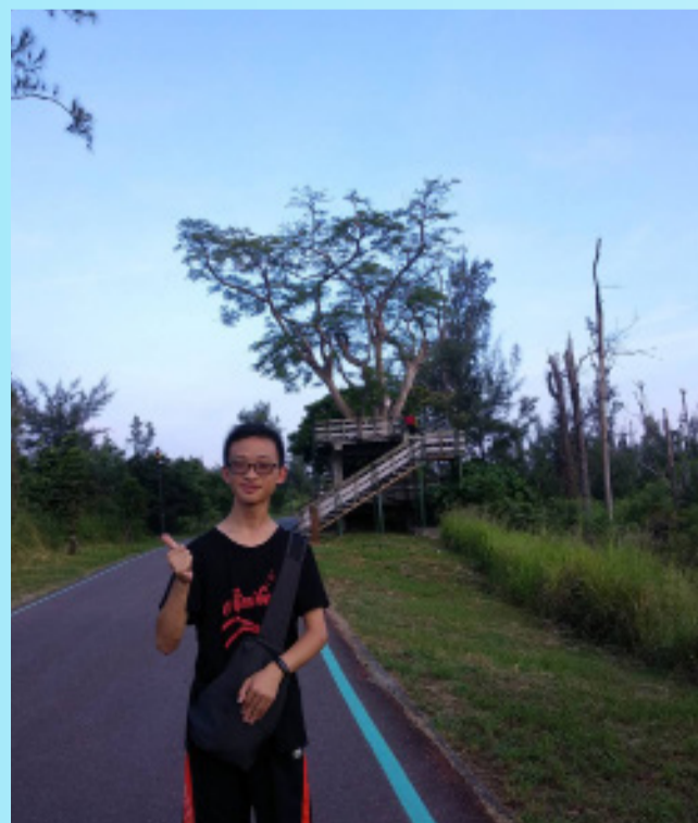
浩竣平日喜愛戶外運動，經常出外踏青

在圖書館除了書籍的整理、上下架，還要負責服務、指引讀者，在這些工作當中學到整理能力，除此之外因為能跟其他人工作交流的機會，溝通能力也加強了。