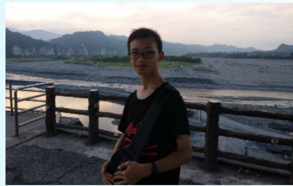
浩竣除了擔任志工，平日裡也喜歡爬山